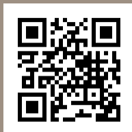
AVEC Gremio shop